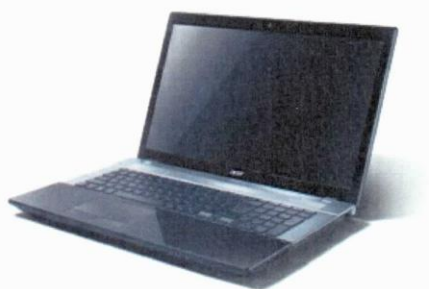
Acer ASV3-771G 17,3/3630QM/2TB/32G/DVD/NV/B/BR/W8