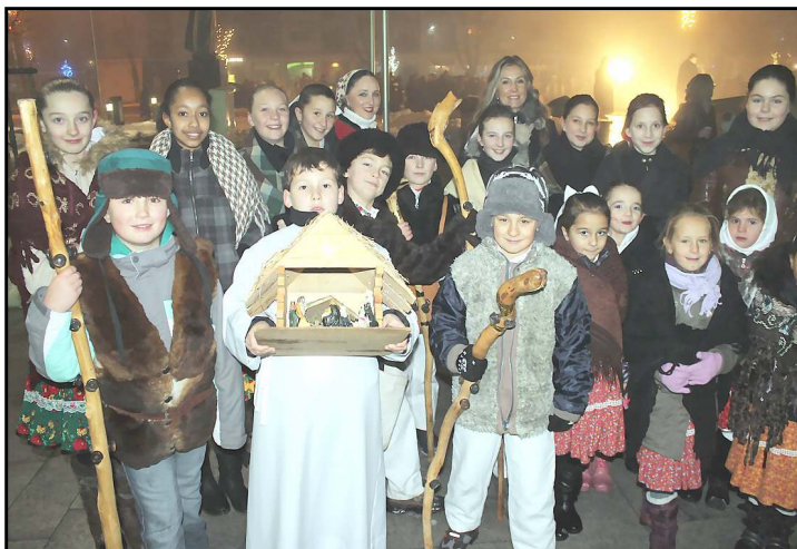
Predčasný príchod vianočných sviatkov zvestovali v nedeľu 16. decembra na námestí vo Vranove aj vinšovníci z detského folklórného súboru Ďateľinka pôsobiaceho pri ZŠ Lúčna vo Vranove.