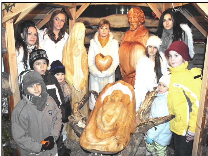
V centre Vranova pribudol Betlehem z čičavskej chránenej dielne.